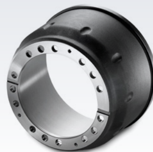
Originalne bębny hamulcowe MAN