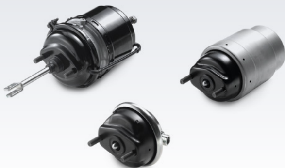
Originalne cylinderki hamulcowe MAN