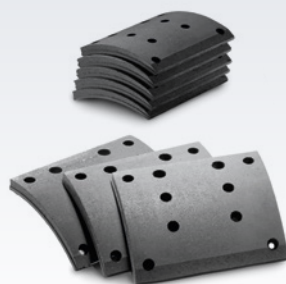
Originalne okładziny hamulców bęnowych MAN