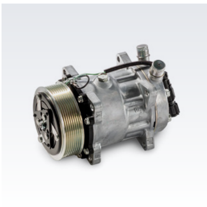
Originalne sprężarki czynnika chłodniczego MAN