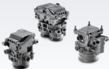
Originalne zawory hamulcowe MAN