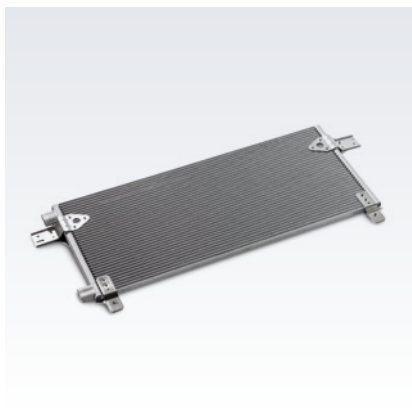
Originalne skraplacze czynnika chłodniczego MAN

Modele SPX 1200 i Cooltronic przeznaczone do pojazdów z wysokimi spoilerami dachowymi.